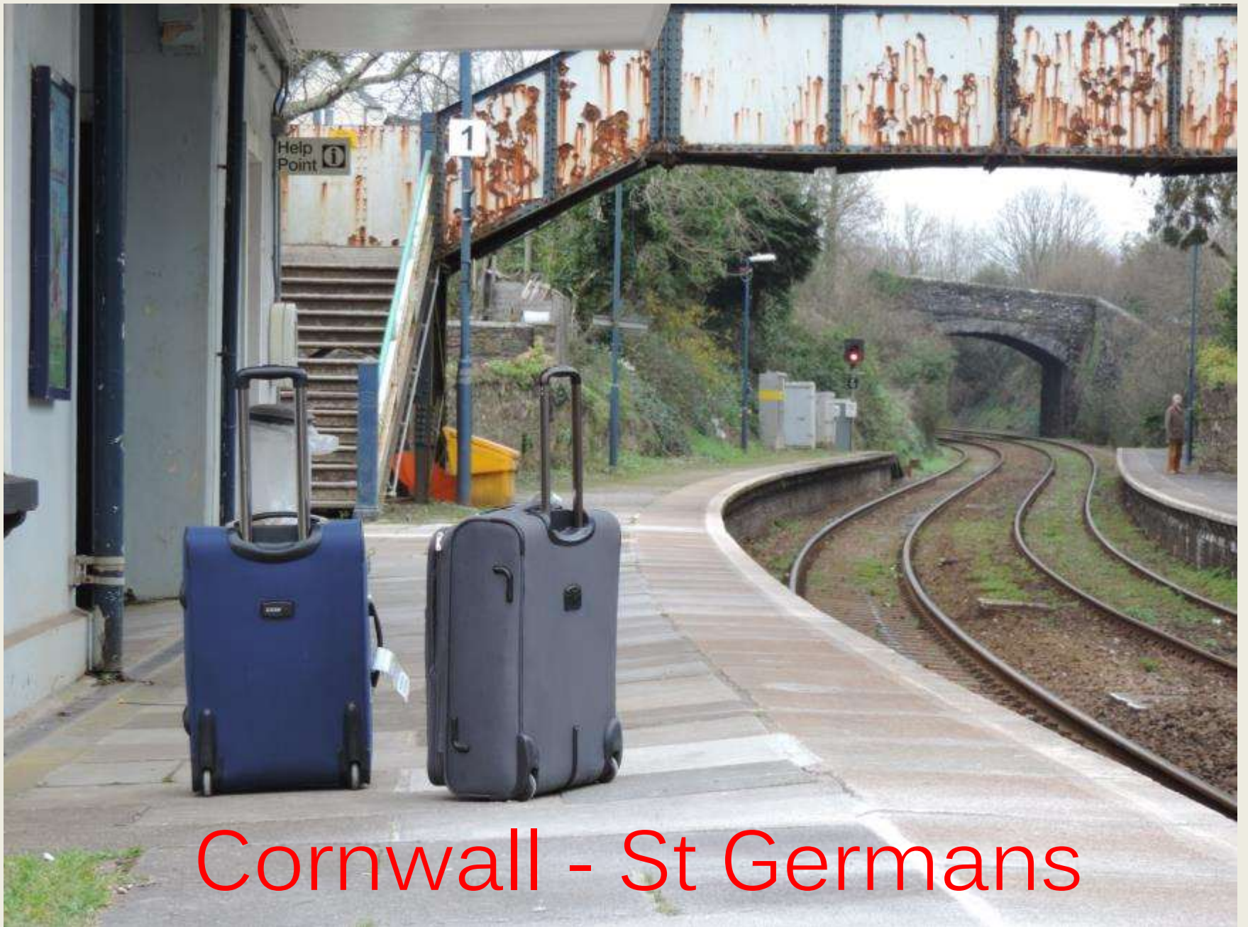
Cornwall - St Germans