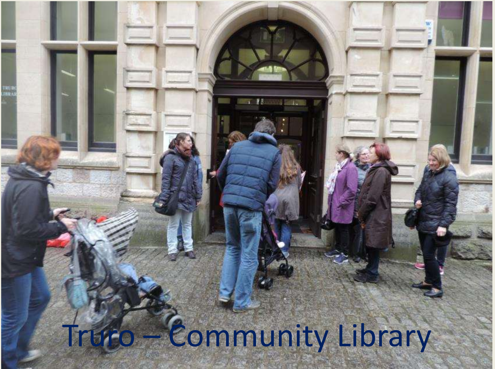
Truro – Community Library