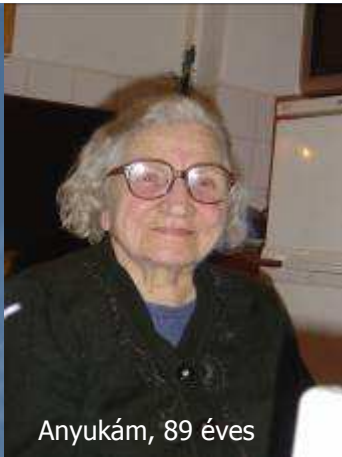
Anyukám, 89 éves