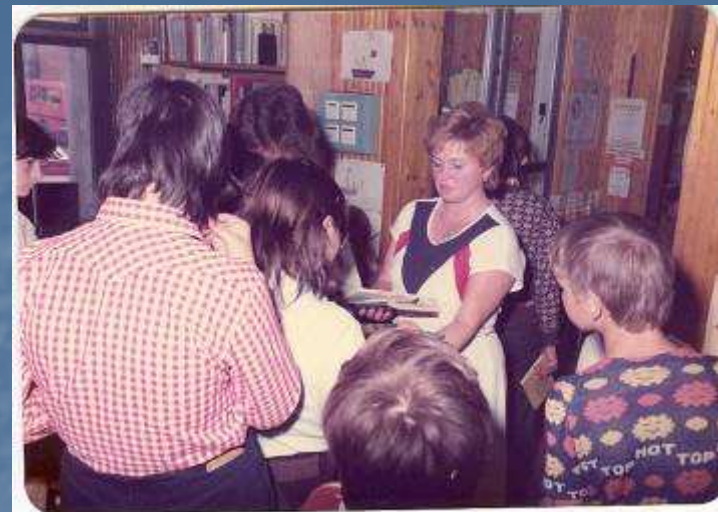
1974 FSZEK 27/4 KÖNYVTÁR