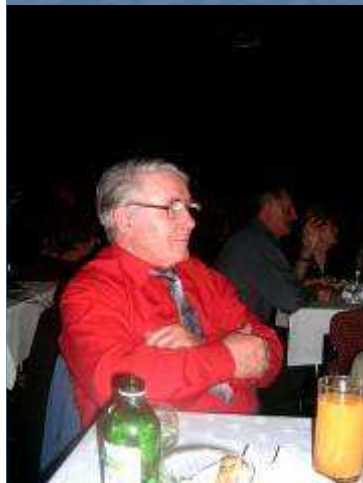
Életem párja 43 éve