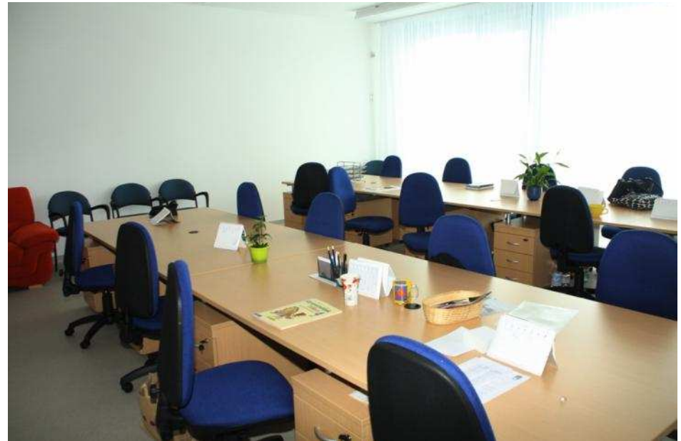
fent: tanári szoba lent: nyelvi labor