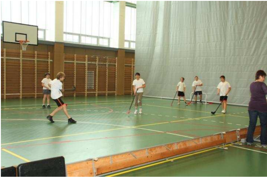
fent: elválasztható tornaterem lent: AULA, ahol az iskola valamennyi tanulója elfér